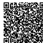
C Merkblatt Nutzung von Aussenräumen im Siedlungsgebiet